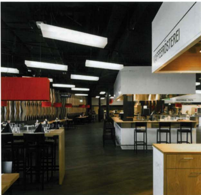
Bei My Stop verändert sich die Lichtqualität adäquat zu einzelnen Etagen der Raststätte bzw. zu verschiedenen Nutzungen der Etagen. // At My Stop the light quality changes in line with the various floors and/or room purposes on the floors of the roadhouse.